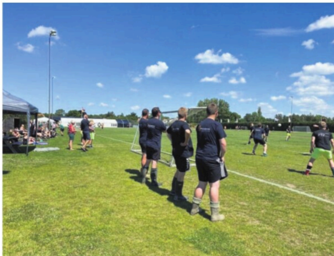
I den forgangne weekend var der gadevej-stævne på Øster Ulslev Boldklubs område med kampstart klokken 13 lørdag. Alle spillere, der var fyldt 15 år, kunne deltage i de traditionære fodboldlejer, hvor DJ Søren spillede op under kampene.