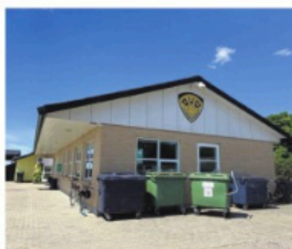
Klubhuset på Korsvej kommer til at danne ramme om gade ØUB-aneddoter i morgen fra klokken 18 til 19.

I bogens kapitel om 1980'erne behandles det dramatiske forløb omkring Krumsøskolens nedlæggelse, da denne institution spillede så stor en rolle for hele Øster Ulslev, og fordi der parallelt