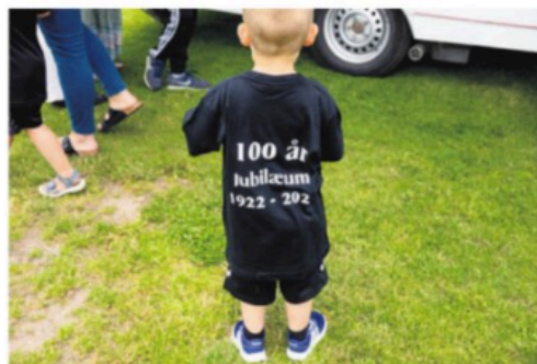
Selv om man måske ikke har så mange måneder på bagen i fodboldspillet, kan man da sagtens være med til at fejre et 100-årsjubileum for Øster Ulslevs gode, gamle fodboldklub.